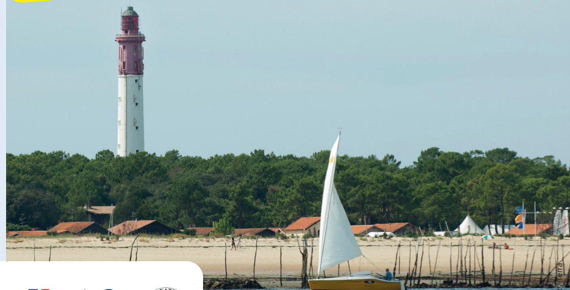
Laurent Mignaux / OFB

Journées européennes du Patrimoine 17 & 18 SEPT. 2022