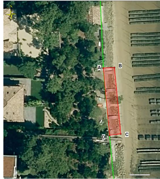
Figure 2 : Projet AOT M. Fournier

Les demandes portent sur deux ouvrages respectivement de 120 et 170 m 2 composés d'enrochement en calcaire non jointoyés au béton et d'un pied d'ouvrage en palplanches. Le projet d'AOT précise que les matériaux employés doivent être exempts de tous produits susceptibles de porter atteinte à la qualité de l'eau, au milieu marin et terrestre environnant.